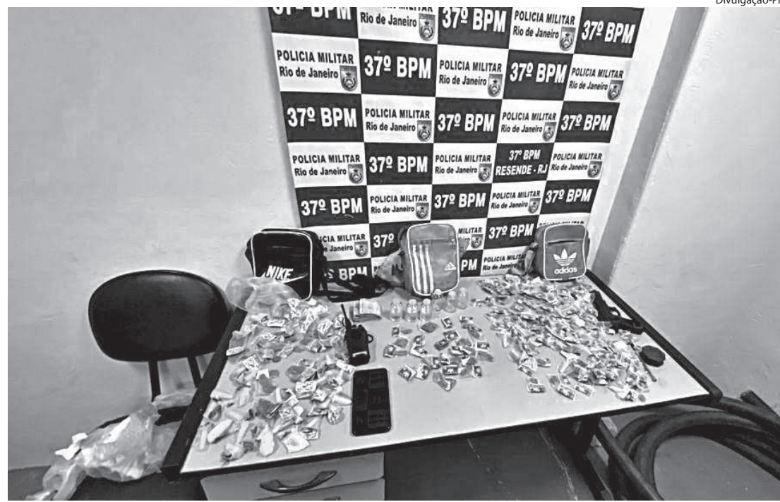
DROGAS apreendidas foram entregues na sede policial

O trio e o material apreendido foram apresentados na 89ª Delegacia de Polícia (DP). O jovem foi autuado em flagrante por tráfico, associação para o