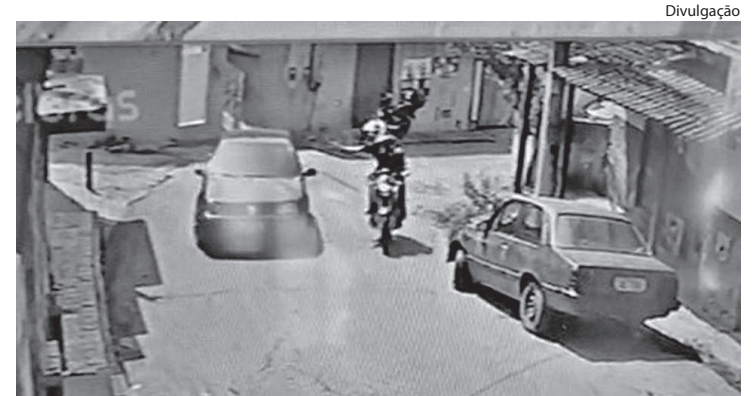
ELE CHEGOU em uma motocicleta e atirou na vítima, que estava dentro de um carro